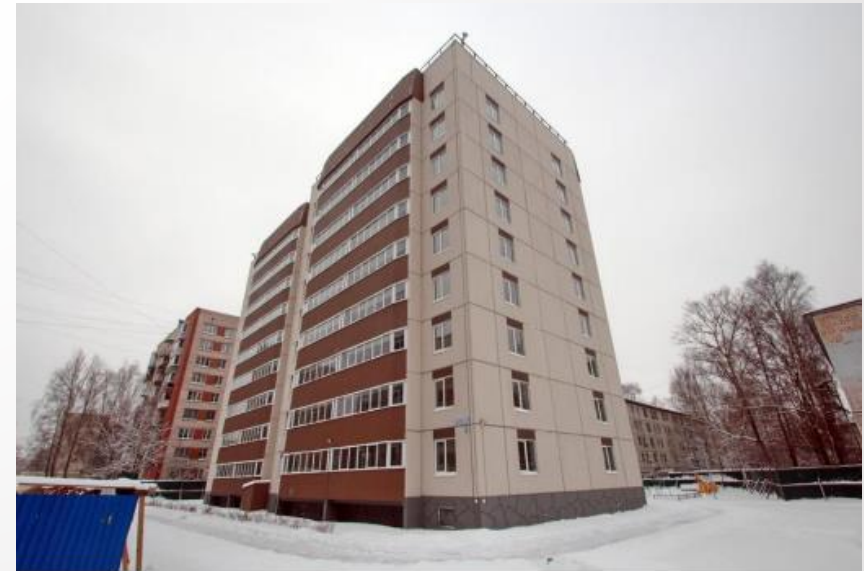
Красных Партизан 3