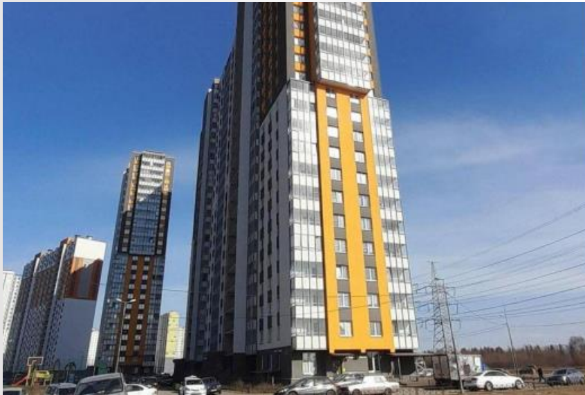
Муринская дор. 14к2