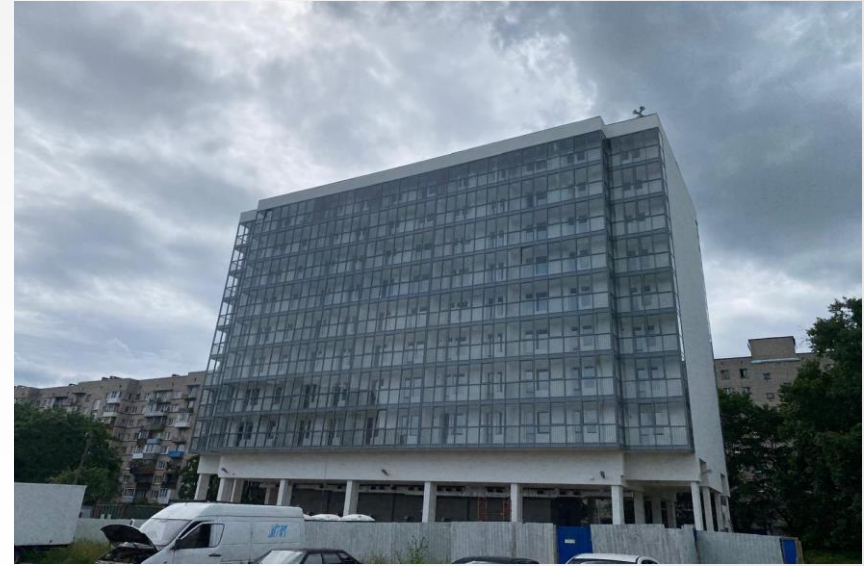
Красное село, Кингисеппское 4